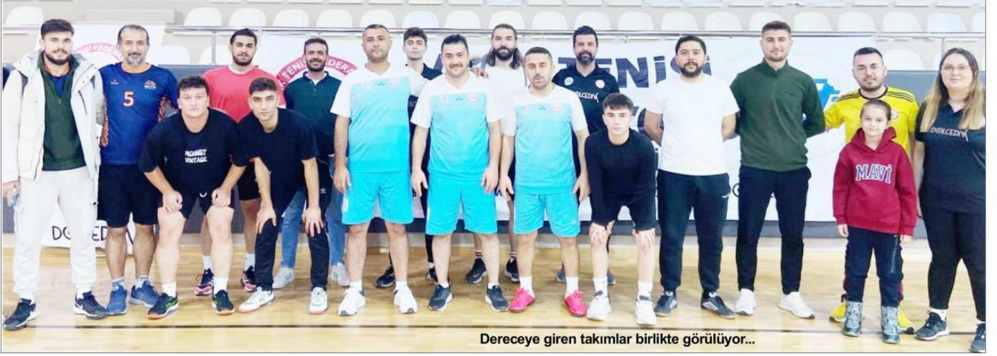
Dereceye giren takımlar birlikte görülüyor...